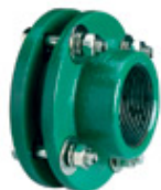
Unión doble mixta con brida