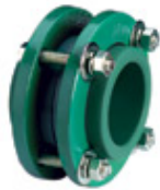
Unión doble con brida