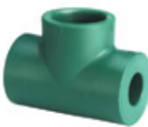
Te de reducción extrema