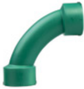
Curva a 90°