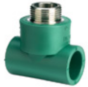
Te con rosca central macho