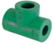
Te de reducción extrema y central