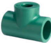
Te de reducción central