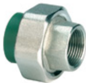
Unión doble mixta