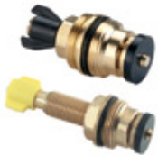
Cabezal a pistón (repuesto llave de paso total)