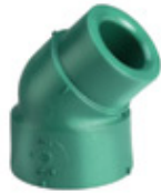
Codo macho-hembra a 45°