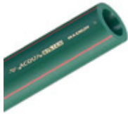
Tubo Acqua System Magnum PN25