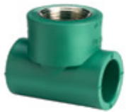
Te con rosca central hembra

Haga click en las imágenes si quiere ver más detalles del producto