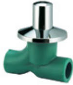
Llave de paso (pasaje total)