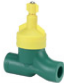
Llave de paso total modelo Brasil