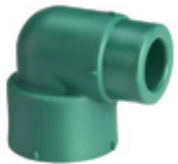
Codo macho-hembra a 90°