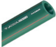
Tubo Acqua System Magnum PN20