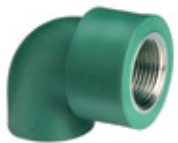
Codo 90° con rosca hembra