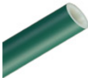
Tubo Acqua Lúminum