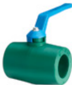
Válvula esférica con manija