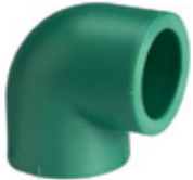
Codo a 90°