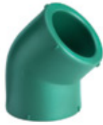
Codo a 45°