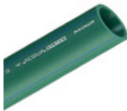
Tubo Acqua System Magnum PN12